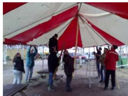
Första arbetsdagen på Åkers Kanal, depå- tät reses.