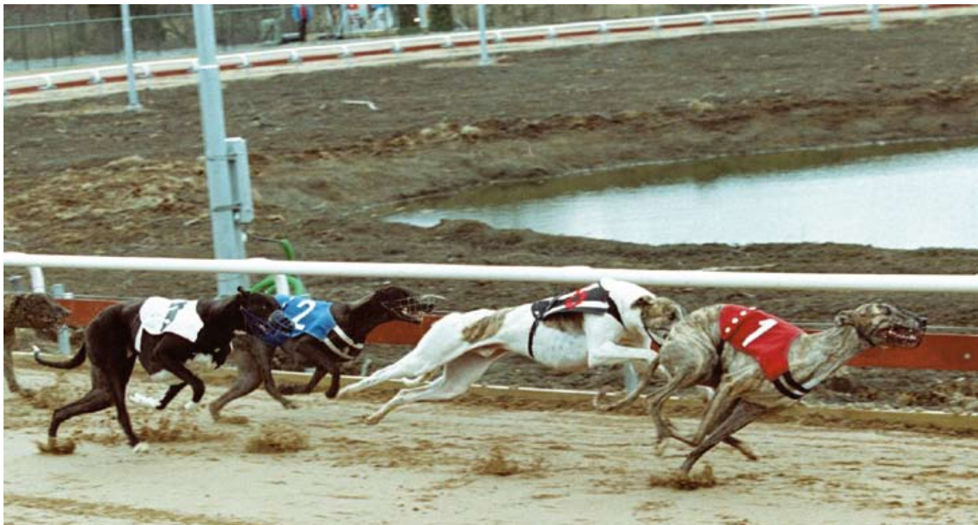
Lopp 5: Box 1 Peek A Boo, 1:a 19.64, box 6 Revenge, 2:a 19.69, box 2 Etna, 4:a 19.97, box 3 Karneol, 3:a 19.74.

Den 15 april 2010 är det 10 år sedan starten på Åkers Kanal Greyhound Park. Då startades också spelet på Greyhound Racing upp. Här följer lite utdrag ur Hundkapptidningen nr 2 år 2000, som beskriver lite hur starten gick till.