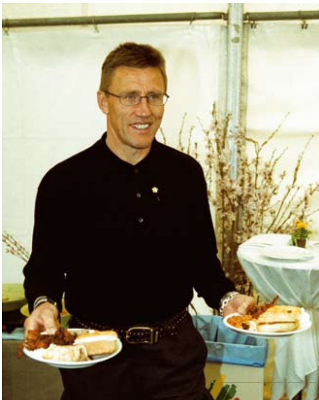
En av festdeltagarna på Åkers Kanal, Börje Salming låter sig väl smaka av maten.

Lopp 3: Box 4 Soulman, 1:a 33.64, Box 2 Mo Ghile Mear, 3:a 34.16, Box 5 Whirlie Girl, 2:a 34.13, Box 5 Rave Ruby, 4:a 34.36, Box 3 Vera Veronica, 5:a 34.41, Box 1 Disco Girl, 6:a 34.44.