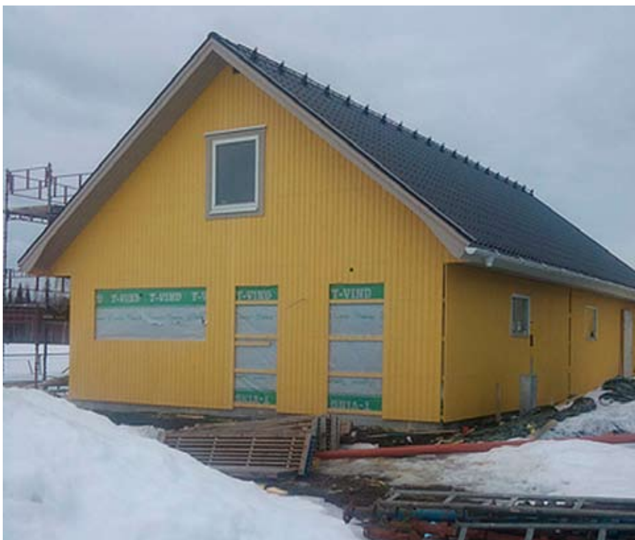
Skellefteås nya klubbstuga under byggnation 10/4 2010.

Hund som överskrider eller underskrider de toleransnivåer, som anges i regelverket vid första invägningen, skall inte meddelas tävlingsförbud förrän veterinären har gjort en veterinärmedicinsk bedömning