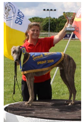
Sprint SM, segraren Crimdon Boa.

Crimdon Boa debuterade i juni och hann under året med tio starter. Utav dem var sex segrar och bara vid ett enda tillfälle